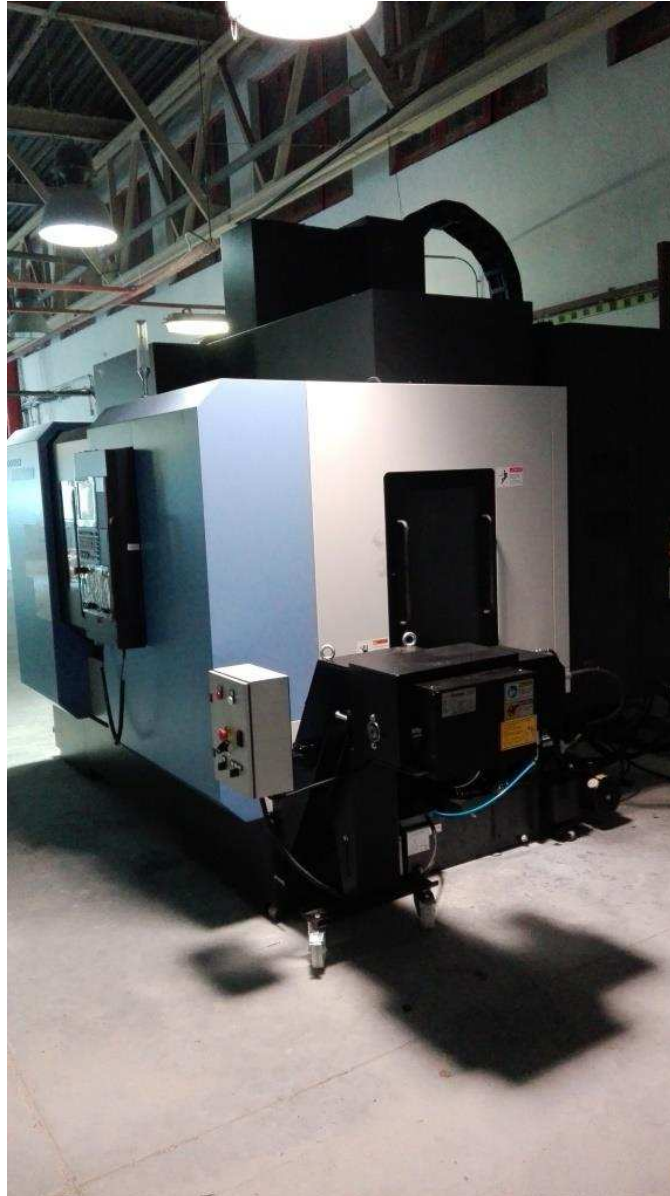
5. fotó: DOOSAN DNM 350-5AX CNC megmunkáló központ