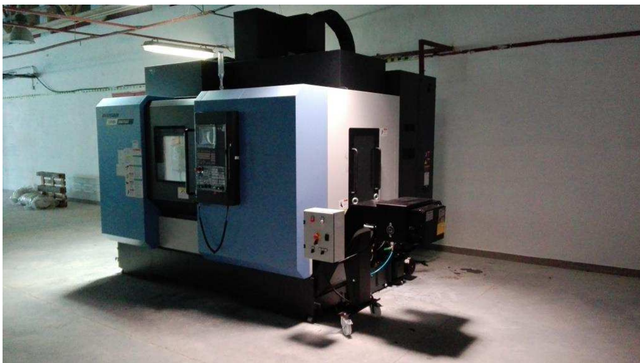
2. fotó: DOOSAN DNM 350-5AX CNC megmunkáló központ