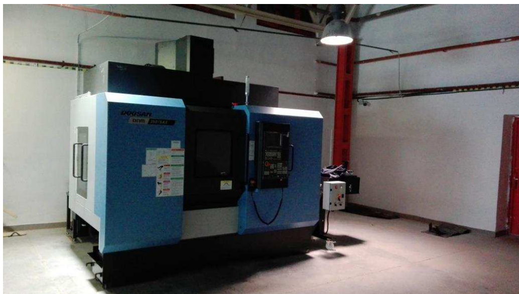
3. fotó: DOOSAN DNM 350-5AX CNC megmunkáló központ