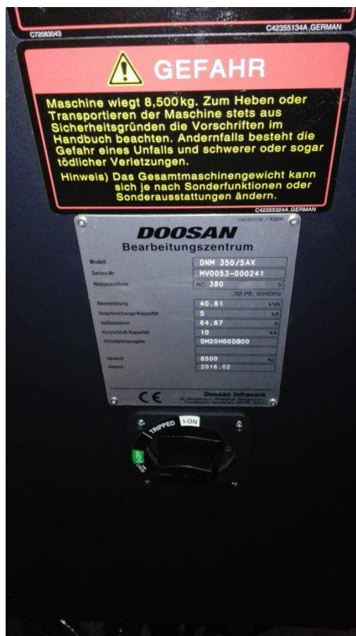
4. fotó: DOOSAN DNM 350-5AX CNC megmunkáló központ